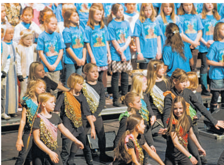
„Mose“ hieß das jüngste biblische Großprojekt der Creativen Kirche, hier mit einer Szenenbild der Dezember-Aufführung.