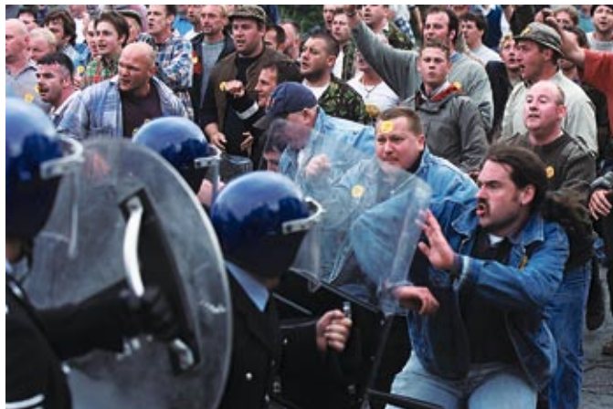
Jeremy Deller, The Battle of Orgreave , 2001