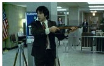
Pierre Huyghe, The Third Memory , 1999 T.R. Uthco & Ant Farm The Eternal Frame , 1975

History Will Repeat Itself ist das erste umfassende Ausstellungsprojekt zum Thema Reenactment in Deutschland. Es findet in der spektakulären, 2.200 qm großen PHOENIX Halle statt, die der HMKV seit Ende 2003 nutzt. Die 1895 erbaute Halle steht auf dem Gelände des ehemaligen Stahlwerks Phoenix West in Dortmund-Hörde.